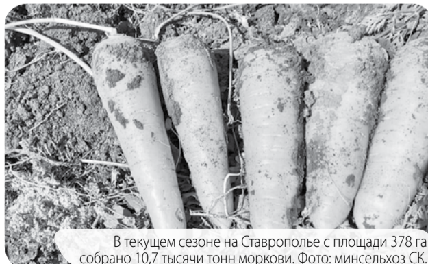
В текущем сезоне на Ставрополье с площади 378 га собрано 10,7 тысячи тонн моркови.

На сегодняшний день, по данным минсельхоза края, завершена уборка овощей открытого грунта и картофеля. В составе борщевого набора картофеля собрано 140 тысяч тонн, овощей – 123,1 тысячи тонн. Наш регион более чем