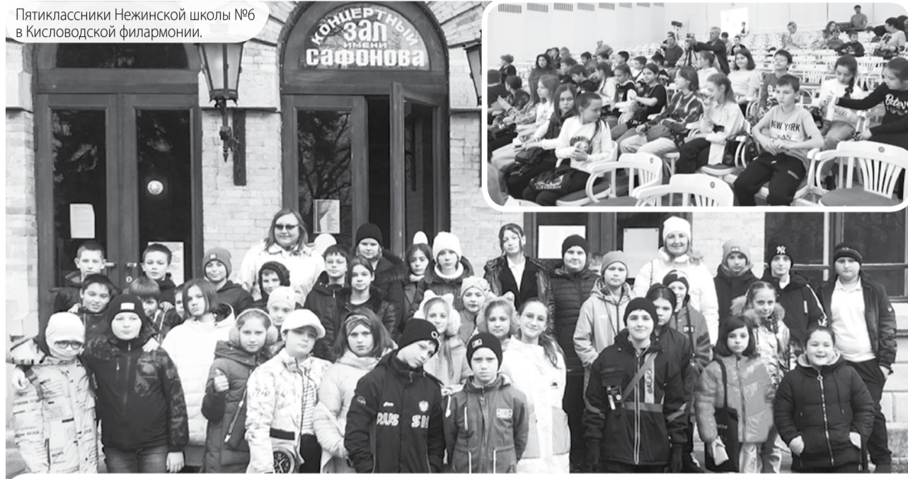
Пятиклассники Нежинской школы №6 в Кисловодской филармонии.